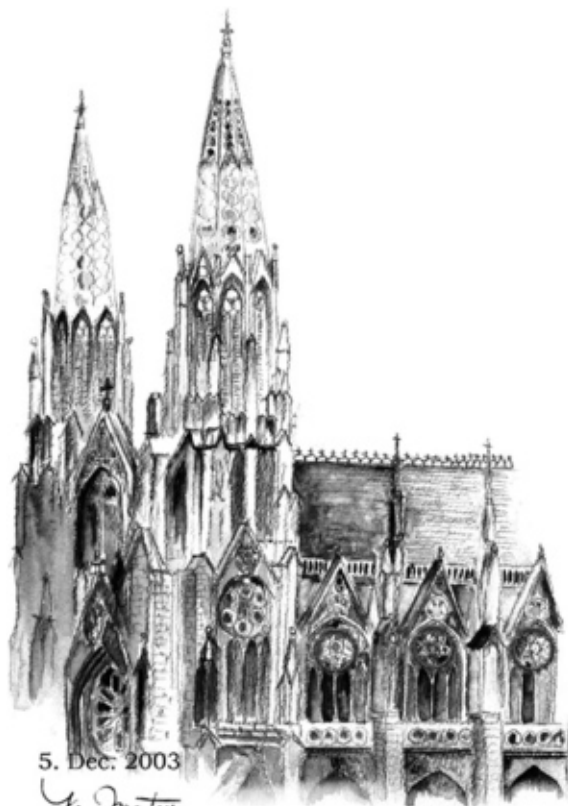
セントパトリック教会