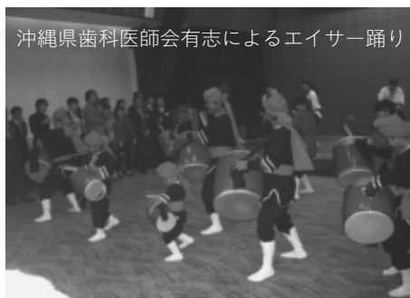
沖縄エイサー踊り