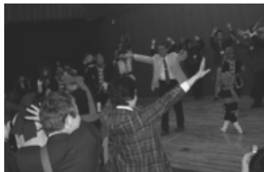
エイサー隊の余興を楽しむ参加者

会では、沖縄歯科医師会有志のエイサー隊による余興もあり、参加者が全員で歌い踊って、学術大会とはまた別の楽しい沖縄の思い出となった。